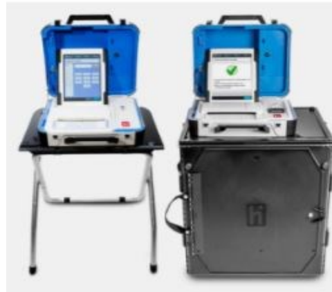
Verity Duo Voting Booth & Verity Scan Station

3. Follow the Prompts on the screen using the TOUCH SCREEN to make selections USING the REVIEW & NEXT buttons to move back & forth between ballot pages.